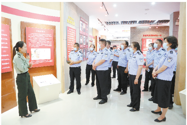
“七一”前夕,西华县组织开展了形式多样、丰富多彩的庆“七一”系列活动,营造了浓厚的节日氛围,表达了对党的深厚感情和无限热爱。图为该县组织党员干部在杜岗会师纪念馆开展“重温入党誓词”活动。