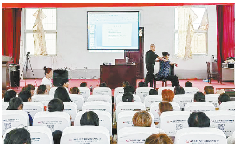
7月5日,为期10天的西华县西夏亭镇“人人持证、技能河南”保健按摩培训班正式开班,该镇86名学员参加培训。

本报讯(记者 张猛 通讯员 常军伟 杨娜)7月1日,西华县委书记田林带领县财政局、县自然资源局、县住建局、县城管局以及各个平台公司主要负责同志调研督导中心城区道路提升改造项目推进工作。县领导刘贡献、马超、韩秀娟、王超等参加调研。