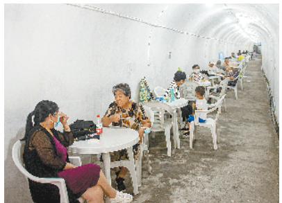
浙江杭州持续高温天气 7月14日,杭州市民在曙光路避暑纳凉点休息乘凉。7月1日起,杭州市共有5处人防工程免费开放,供市民避暑纳凉。近日,杭州市气象台连续发布高温红色预警信号,提醒市民做好防暑降温、遮阳防晒与防溺水工作。