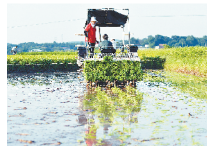
“双抢”农事忙 7月14日,在东安县井头圩镇芭蕉村,农民驾驶插秧机在田间插秧。盛夏时节,湖南省永州市东安县的27万余亩早稻正值收割期,当地农民利用晴好天气抢收早稻,同时翻整田地、准备晚稻的抢收工作,田间地头一派繁忙景象。新华社发

根据实施方案,2030年前,建筑节能、垃圾资源化利用等水平大幅提高,能源资源利用效率达到国际先进水平;用能结构和方式更加优化,可再生能源应用更加充分;城乡建设方式绿色低碳转型取得积极进展,“大量建设、大量消耗、大量排放”基本扭转;城市整体性、系统性、生长性增强,“城市病”问题初步解决。