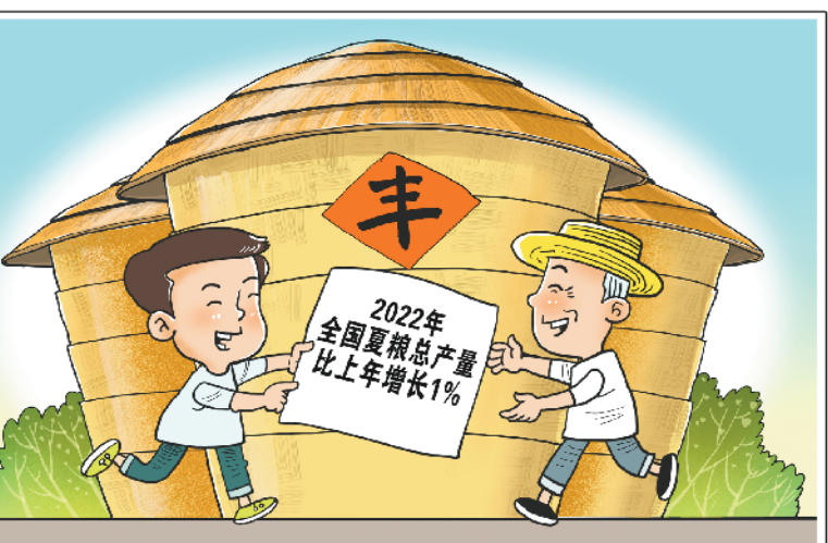
喜获丰收 新华社发 朱慧卿作