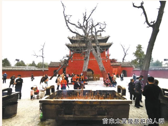
前寨太昊陵祭祀的人群