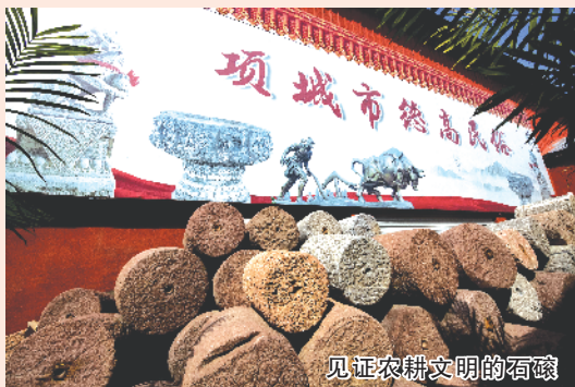
见证农耕文明的石碓