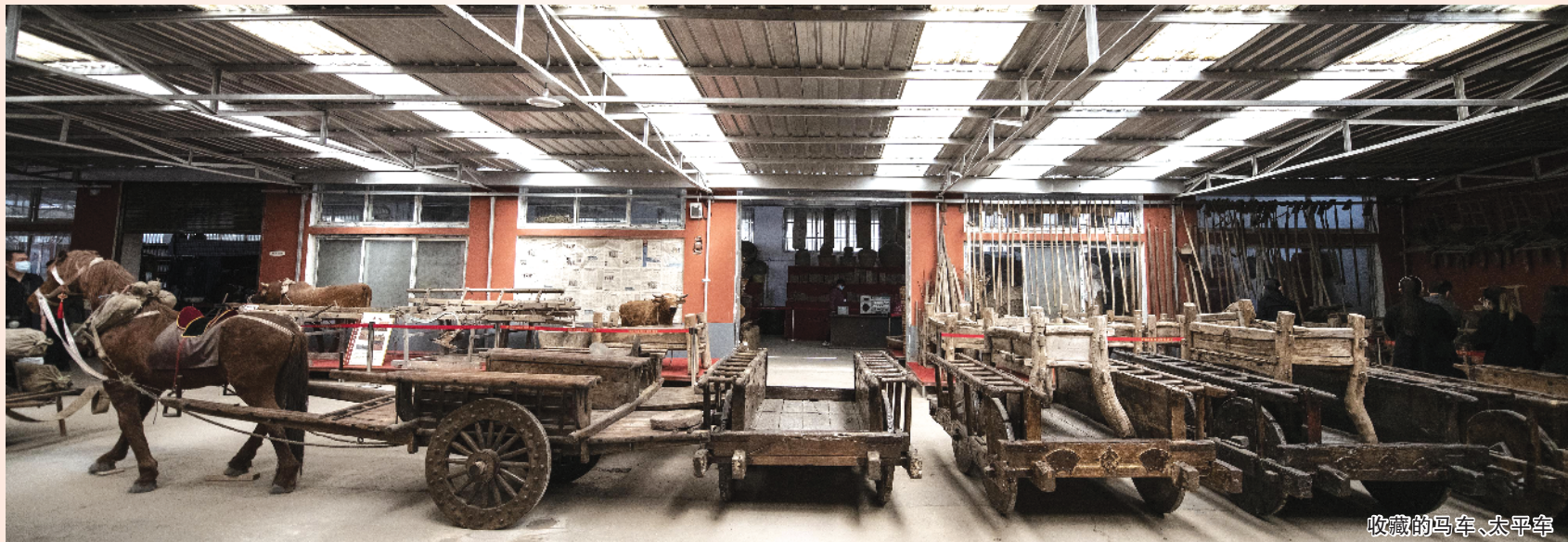
收藏的马车、太平车