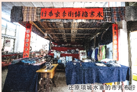
还原项城水寨的市井布行