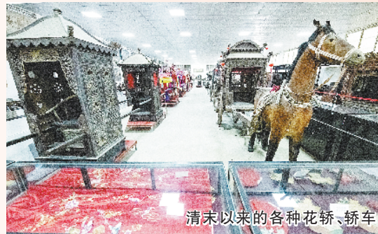
清末以来的各种花轿、轿车