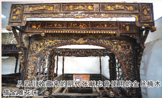
从四川收藏来的明代张献忠曾使用的金丝楠木描金雕花床