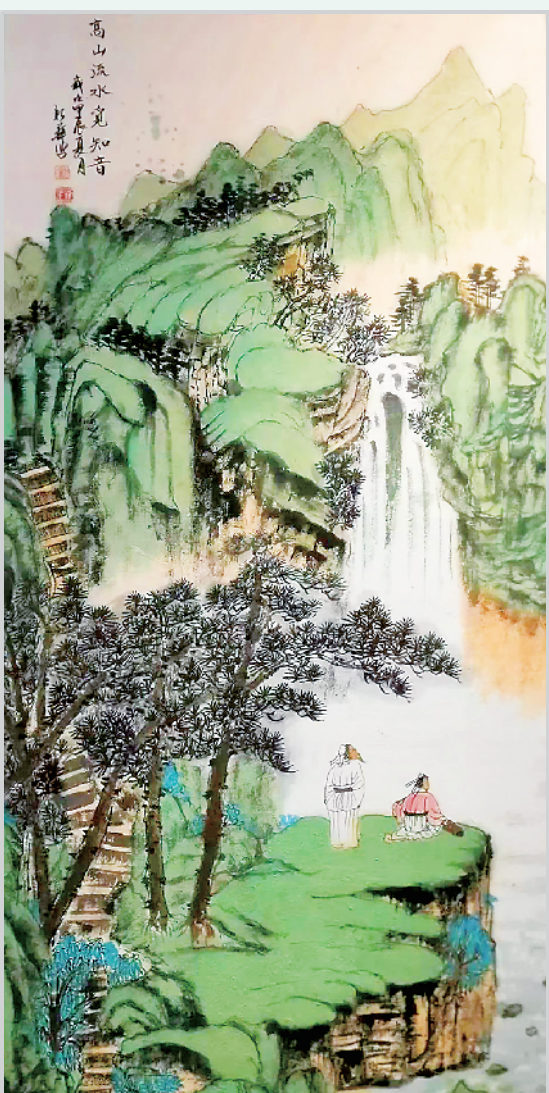
“银龄逸兴 秋月澄怀”周口·新乡老年书画作品联展参展作品。