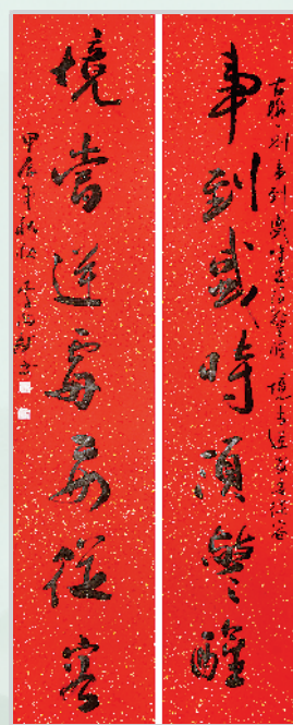
“银龄逸兴 秋月澄怀”周口·新乡老年书画作品联展参展作品。