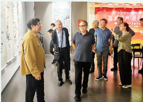
与会周口市老领导兴致勃勃地参观“银龄逸兴 秋月澄怀”周口·新乡老年书画作品联展。