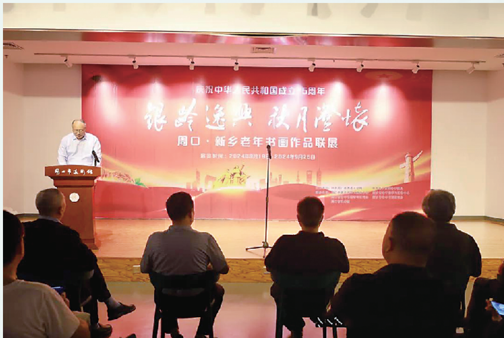
“银龄逸兴 秋月澄怀”周口·新乡老年书画作品联展开幕式现场。