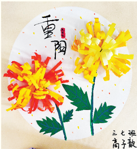
小记者:高子歆 三(7)班 (辅导老师:刘瑞瑞)