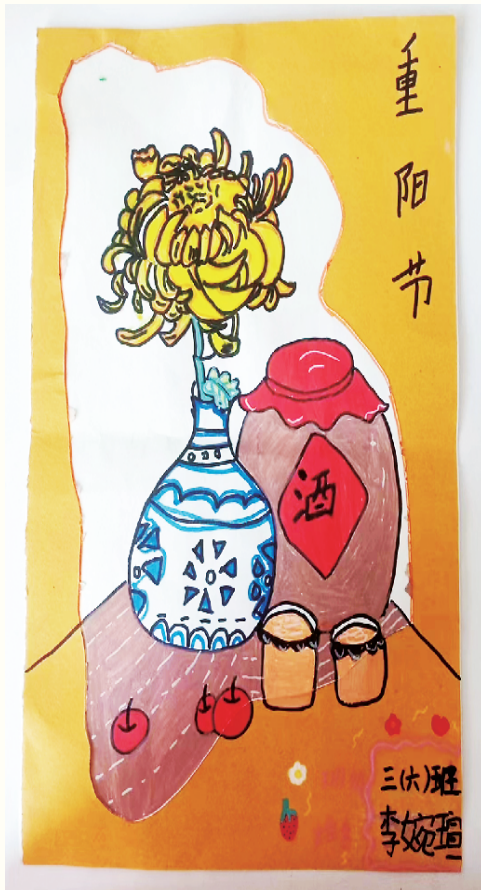
小记者:李婉萱 三(6)班 (辅导老师:吴艳侠)