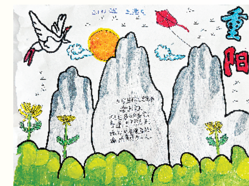
小记者:王逸凡 三(7)班 (辅导老师:刘瑞瑞)