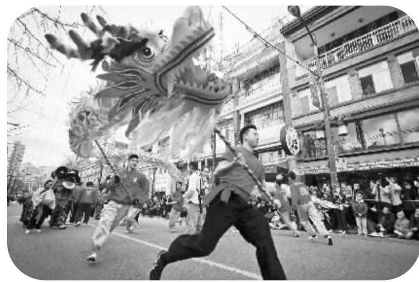
温哥华举行春节狂欢游行

▲2月24日,在山东烟台毓璜顶庙会上,老年锣鼓队进行威风锣鼓表演。当日,在山东烟台毓璜顶庙会上,民间艺人带来了大秧歌、威风锣鼓、舞龙舞狮等民俗表演,为市民和游客献上精彩纷呈的传统文化大餐。