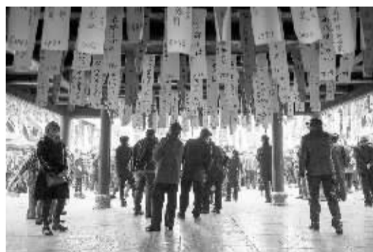
长假尾声 年味依旧

▲2月24日,在合肥市第21届新春文化庙会上,不少市民在猜字谜。新春假期接近尾声,安徽省合肥市第21届新春文化庙会猜字谜、看大戏等浓浓的年味活动,依旧吸引大批市民前来。新华社发