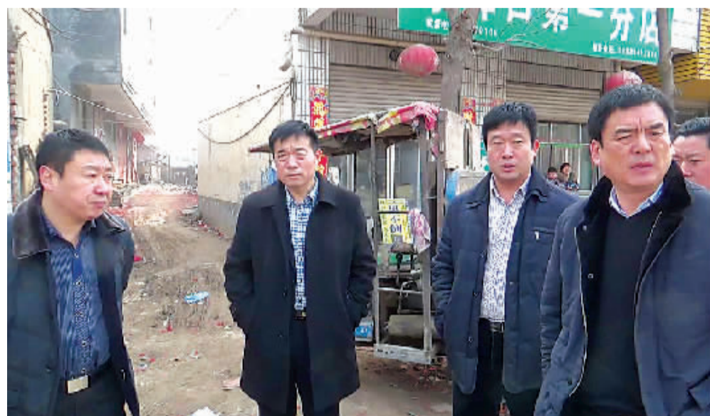
港区领导赵万俊、尚宏伟在现场安排部署下一步城市管理工作