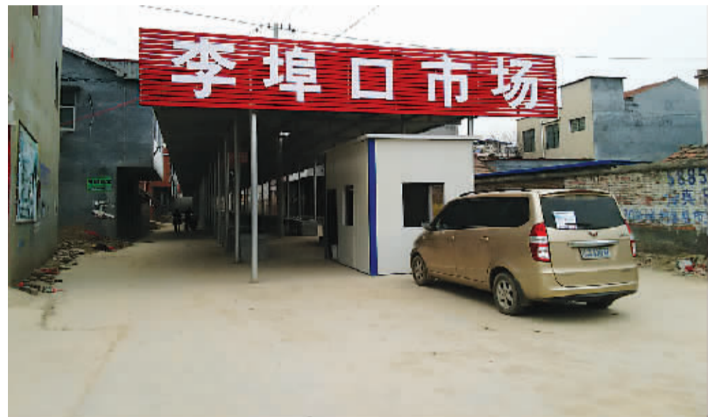
港区李埠口大街南侧建成并已经投入使用的“两小”市场

曾几何时,港区道路不多,走在李埠口大街上总是拥堵不堪,随处可见尘土飞扬、垃圾遍地、污水横流。经过一年多的快速发展,如今,港区可谓处处精彩纷呈:“一横五纵”6条城区大道的铺设工作已接近尾声,行将通车;已建成投入使用的“两小”集贸市场让长期占道经营、以路为家的“马路游商”找到了归宿;已投入使用的安置小区更是成了港区人眼中的“宝”,“先安