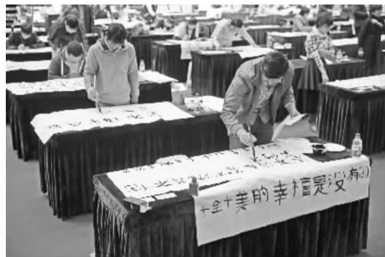
2015“金台杯”世界大学生书法大赛复赛在京举行 4月12日, 参赛选手在现场书写作品。当日, 由中国艺术教育促进会主办的2015“金台杯”世界大学生书法大赛复赛在北京举行。据了解, 本次大赛初赛已于2014年11月完成, 复赛按中国和外国两大组别进行评选, 最终在百余位参赛选手中选出一等奖、二等奖、三等奖和优秀奖。 新华社发

《国务院关于同意中国农业发展银行改革实施总体方案的批复》明确, 中国农业发展银行改革要坚持以政策性业务为主体。通过对政策性业务和自营性业务实施分账管理、分类核算, 明确责任和风险补偿机制, 确立以资本充足率为核心的约束机制, 建立规范的治理结构和决策机制, 把中国农业发展银行建设成为具备可持续发展能力的农业政策性银行。