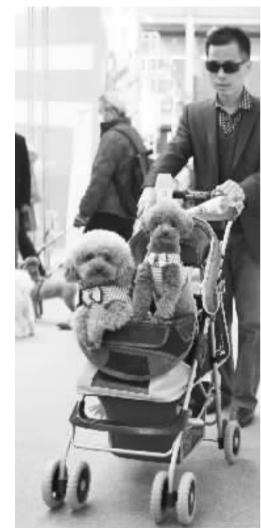
2015中国(北京)宠物文化节开幕 4月11日, 两只泰迪犬坐在儿童车里。当日, 为期三天的2015中国(北京)宠物文化节在北京蟹岛国际会展中心开幕。本届宠物文化节包括“王牌宠物课堂”“第7届WCF国际纯种猫展”“中国纯种犬——北京冠军展”等多个主题活动。