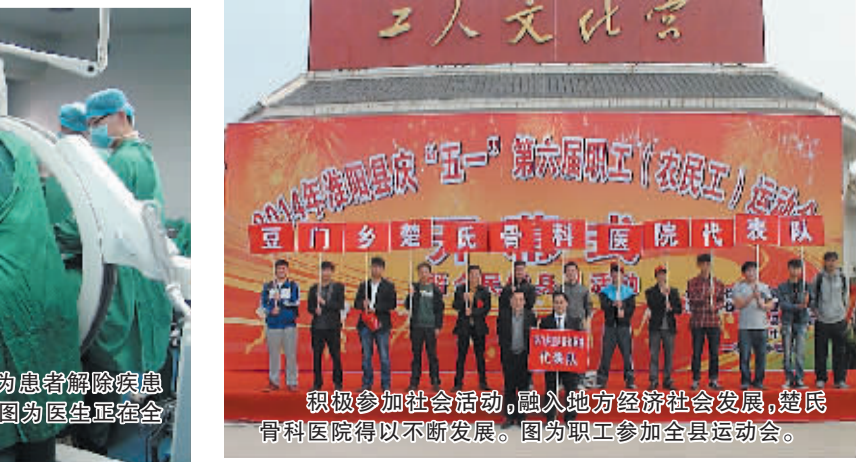
积极参加社会活动,融入地方经济社会发展,楚氏骨科医院得以不断发展。图为职工参加全县运动会。

提供了服务完善、质量优良的中医医疗保健服务。该院重视人才培养和引进,通过公开选拔、公平竞争、择优聘用的方式,建立合理的人才流动和管理体制;引进一批高学历、高层次人才,每年有计划地引进和接收中医骨伤科专业毕业生,提高医院技术人才档次;鼓励在职学历教育,抓好学科带头人及后备人才培养;引入竞争机制,实施激励机制,保持学科带头人相对稳定,保持技术队伍相对稳定,保持主要发展方向稳定,造就一支能适应现代医学科学发展和医学模