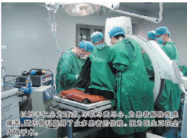
以妙手仁心为理念,尽职尽责尽心,为患者解除疾患痛苦,楚氏骨科赢得了众多患者的信赖。图为医生正在全办做手术。