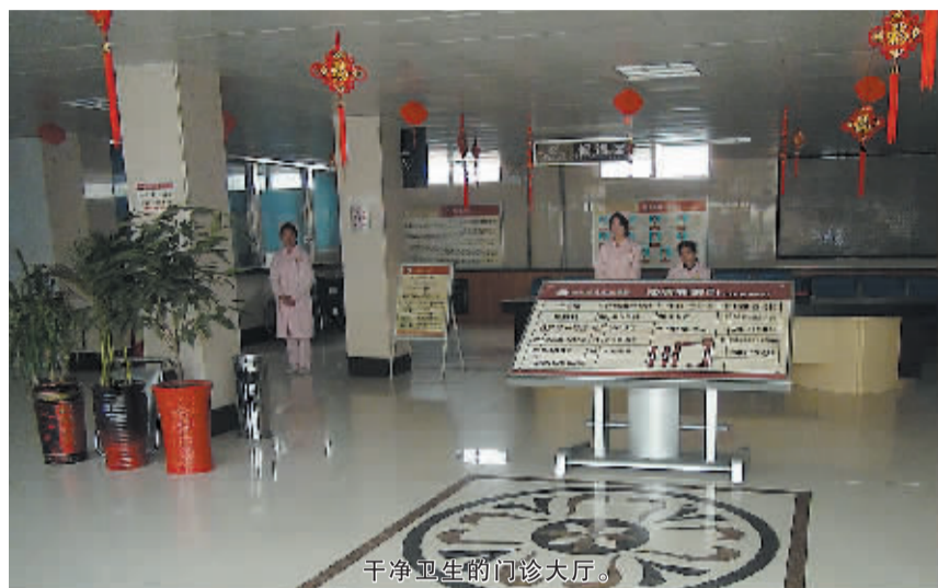
干净卫生的门诊大厅。