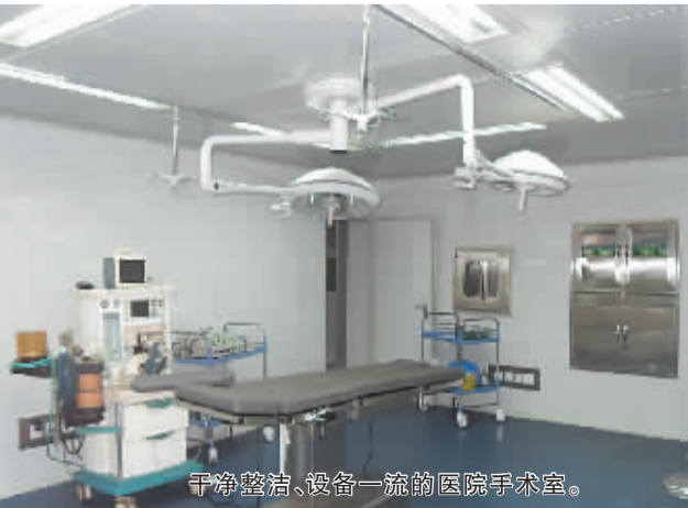
干净整洁、设备一流的医院手术室。