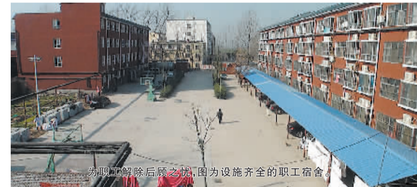
为职工解除后顾之忧,图为设施齐全的职工宿舍。

科医院,建院之初,就树立了“医者仁心、服务社会”的信念,从几间茅草房和简陋的设施起家,凭借一双妙手与真心,逐步取得了患者的信赖。随着其后人不断加入,医院的发展开始了大踏步前进,并迎