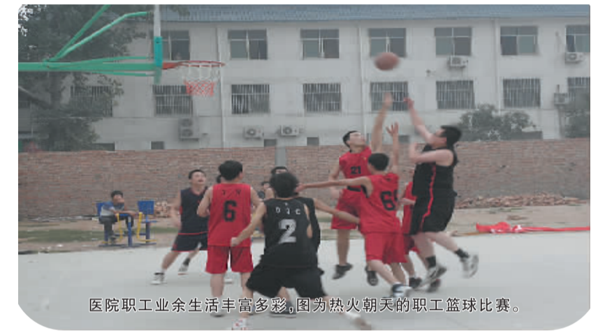
医院职工业余生活丰富多彩,图为热火朝天的职工篮球比赛。

楼。整个建筑群参差错落,错落有致。这家开放床位达200张的医院,多年来形成了自身的医疗技术特色,对各种骨病、骨伤、疼痛、股骨头坏死等疾病,有着独特的方法和经验;医院设置有中医骨伤科、骨外科、显微外科、康复医学科、内科、普外科、检验科、医学影像科、手术室等12个临床和医技科室。全年门诊量突破3万人次,住院5000人次,在广大人民群众当中留下了良好的口碑。