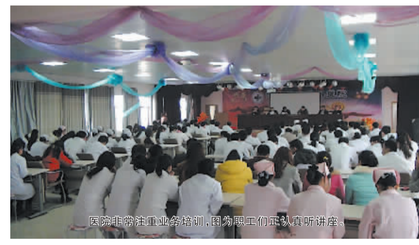
医院非常注重业务培训,图为职工们认真听讲。

缕缕春光,轻烟杨柳,暖风拂面。近日,记者走进淮阳县豆门乡楚氏骨科医院,切身感受到了春天的美好和医院的红火。医院里洋溢着如家的温馨舒适,大气开阔的门诊大厅时刻欢迎四方患者;服务台前护士微笑服务亲切宜人;等候大厅里的患者络绎不绝。红墙青瓦,楚氏骨科医院如一抹亮丽的春色,坐落于淮阳县人文始祖伏羲陵南40公里的淮项交