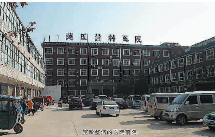
宽敞整洁的医院前院。