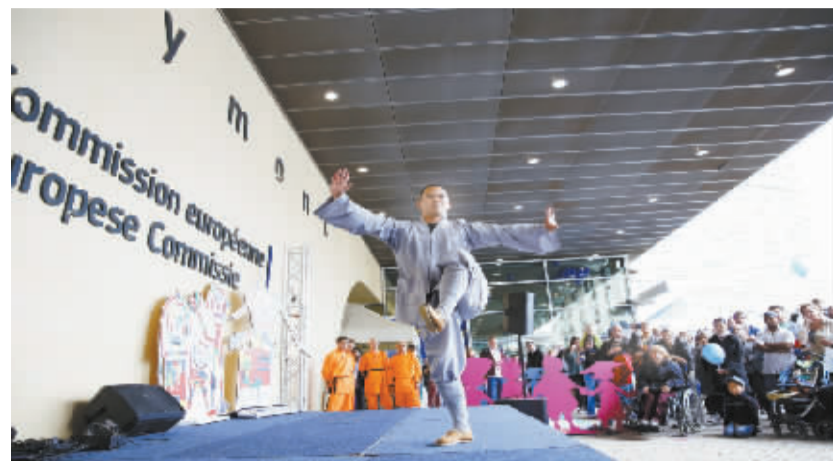
“中国角”首次现身欧盟开放日 5月9日,在比利时首都布鲁塞尔欧盟委员会大楼下,中国武僧表演功夫。当日是欧盟一年一度的开放日。因今年恰逢中欧建交40周年,中国成为欧盟成员国外唯一一个开设宣传角的国家,也是1993年欧盟举办开放日以来中国首次参加,为今年的开放日增添了不少中国元素。

由也门前总统萨利赫领导的全国人民大会党10日也发表声明,宣布接受沙特停火倡议。声明说,停火有助于减轻也门人民因沙特“入侵”而陷入的灾难。声明还说,停火5天是不够的,但这是迈向安定与和平的重要一步。