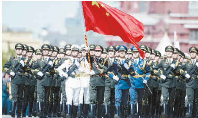
5月9日,在俄罗斯首都莫斯科红场,中国人民解放军三军仪仗队方队行进在阅兵式上。俄罗斯9日在莫斯科举行盛大庆典,纪念卫国战争胜利70周年。

在铿锵有力的鼓乐声中,分列式开始。由1.5万余名军人组成的受阅方阵迈着整齐威武的步伐,精神抖擞地从红场走过。中国、印度、独联体国家等的方队也参加了阅兵式。