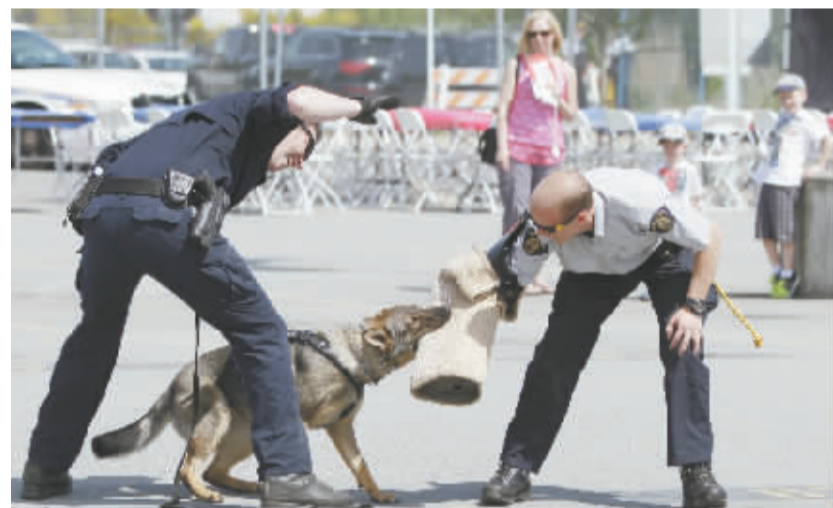
加拿大迎来全国警察周 5月9日,在加拿大温哥华地区的素里市,警察在警局开放日向民众示范警犬训练情况。为迎接一年一度的全国警察周,素里市皇家骑警总部当日举办开放日活动,向民众展示警方装备及介绍警队日常工作。

除现任总统科莫罗夫斯基外,波兰最大反对党法律与公正党候选人安杰伊·杜达、民主左派联盟候选人玛格达莱娜·奥古莱克等人也参与角逐。